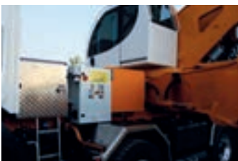
Auxiliary electric pump (380 Volt / 22 kW with inverter) Elettropompa ausiliaria per utilizzo ecologico 380 Volt 22 kW con inverter Elektrische Hilfspumpe mit 380V Motor (22 kW mit inverter) Auxiliary electric pump (380 Volt / 22 kW with inverter)