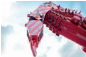
Hook blocks of various capacities Bozzelli di varie portate Verschiedene Unterflasche Moufles de différentes portées