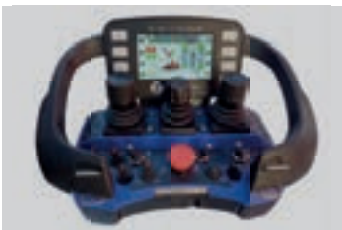
Radio control with display Radiocomando con display Funkfernsteuerung mit Display Radiocommande avec afficheur