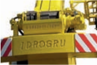
Secondary winch Argano secondario Sekundär Hubwinde Cabestan secondaire