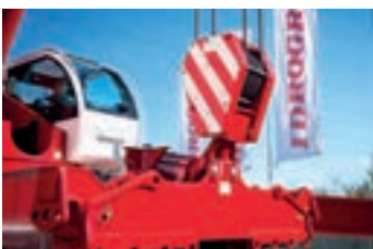
60 t lift spreader beams Bilancino da 60 t per sollevamento carichi 60 Tonne Traverselift Palonnier de 60 t pour le levage des charges