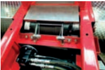
Towing winch Verricello di traino Zugwinde Treuil d'entraînement